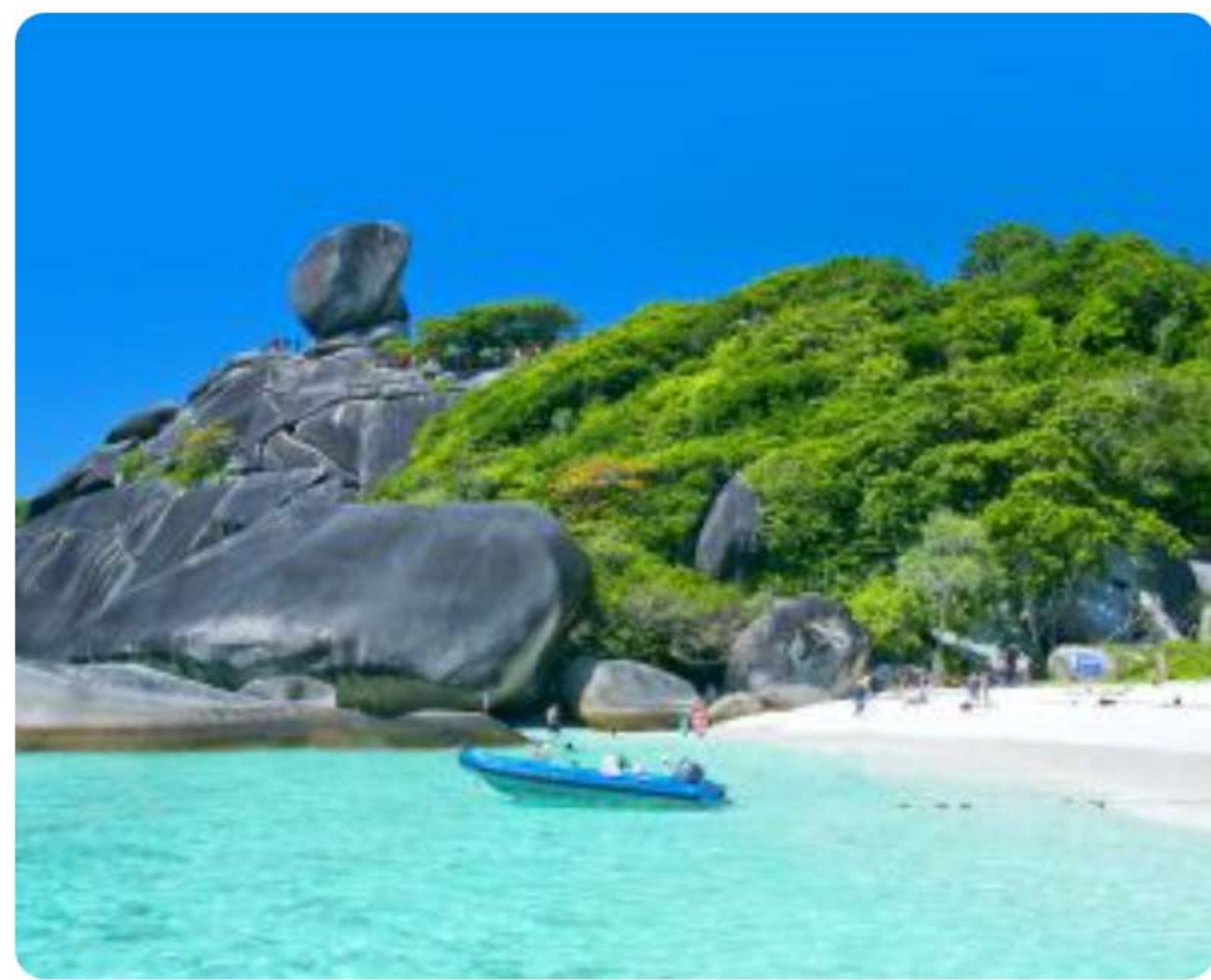
斯米蘭群島潛水 從42,000泰銖